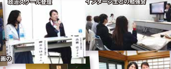
インターン生との勉強会