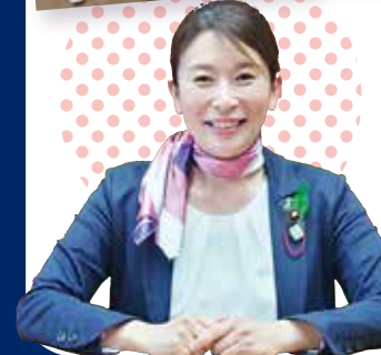
選挙ドキュメンタリー映画の上映サポート